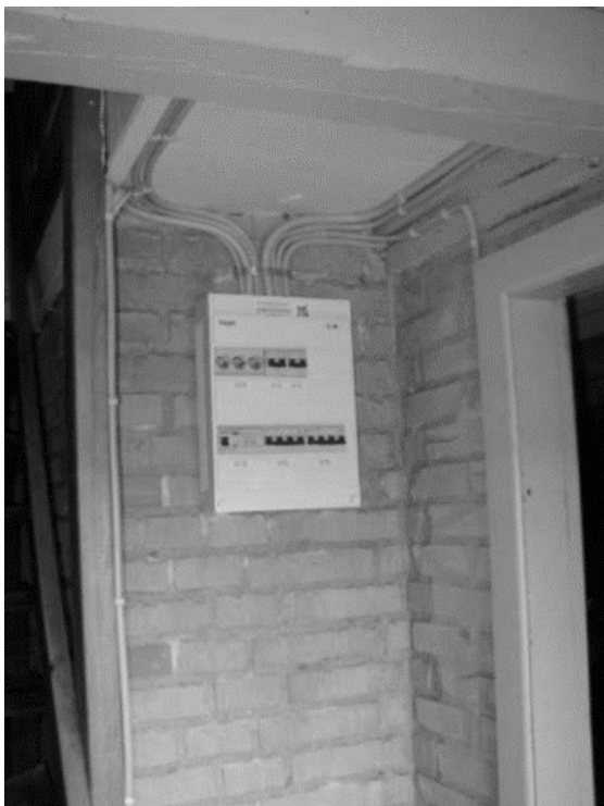
Den nye eltavle i Torp