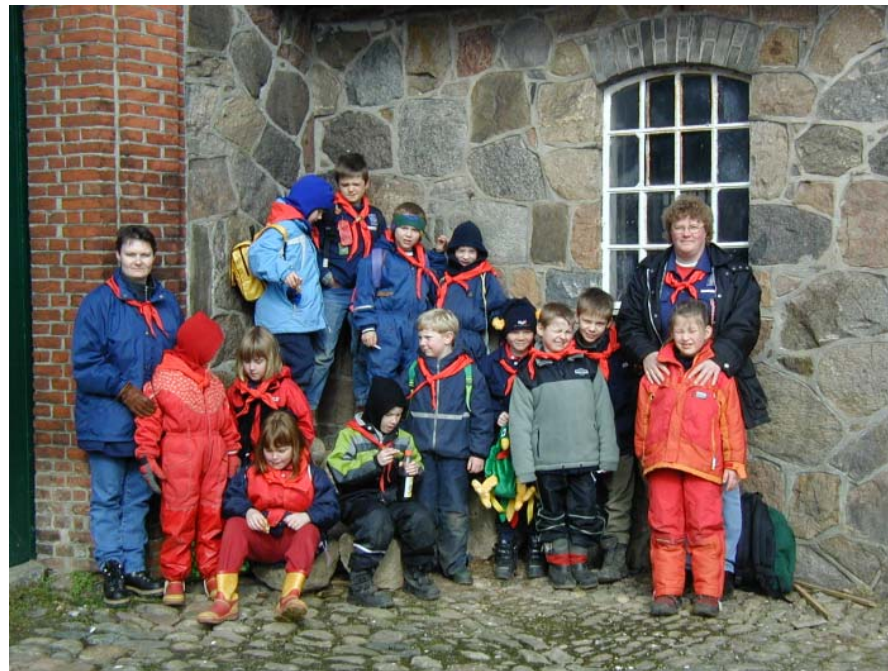
Glade mikrospejdere og mikroledere på mikrodagen

Mange store mikrohilsner fra de 5 ledere